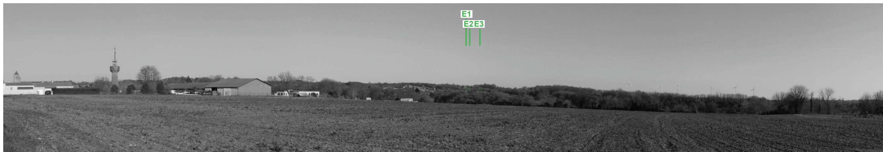
Vue panoramique noir et blanc avec esquisse du projet (angle de vue 120°)

Coordonnées Lambert II étendu : 403170 / 2142730 Date et heure de la prise de vue : 14/02/2019 à 17:35 Focale : 52 mm, équivalent 24 x 36 Azimut vue réaliste : 101° Angle visuel du parc : 1,9° Eolienne la plus proche : E1, à 11 201 m